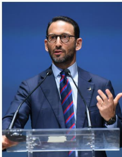
FEDERICO FRENI SOTTOSEGRETARIO ALL'ECONOMIA

giacché il rappresentante governativo ha anche sottolineato che «il futuro è nell'equity».