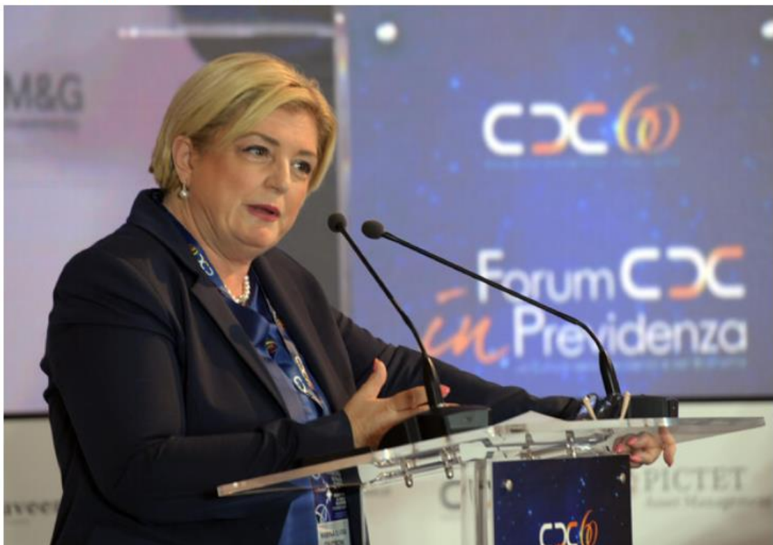
La ministra del Lavoro e delle Politiche Sociali Marina Elvira Calderone