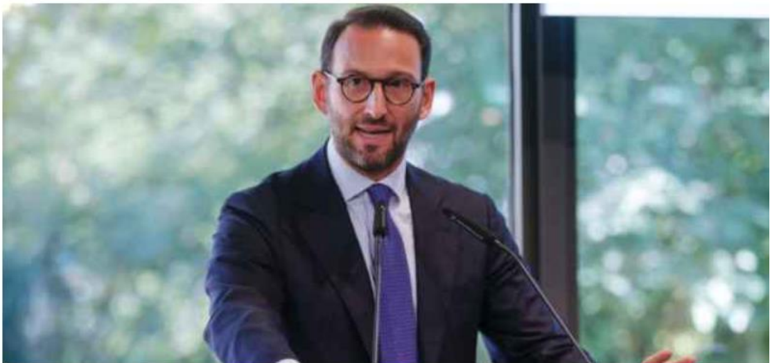
Federico Freni, sottosegretario all'Economia

Riforma pensioni, il sottosegretario all'Economia Federico Freni spiega che Quota 41 resta un obiettivo di legislatura che verrà perseguito