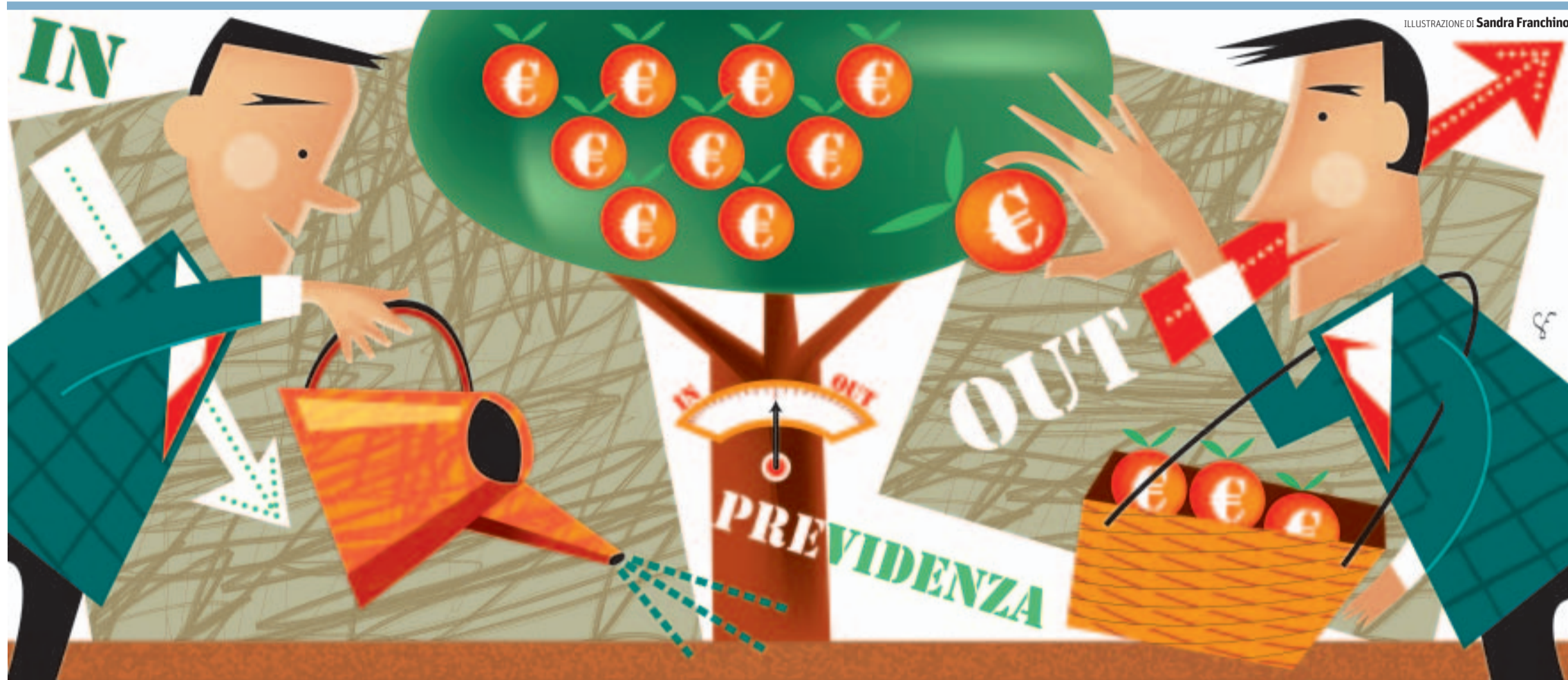
ILLUSTRAZIONE DI Sandra Franchino