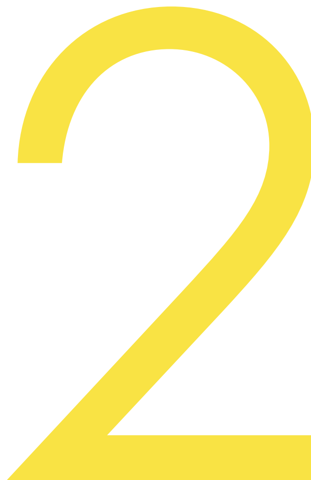
Tavola 2 Budget Finanziario