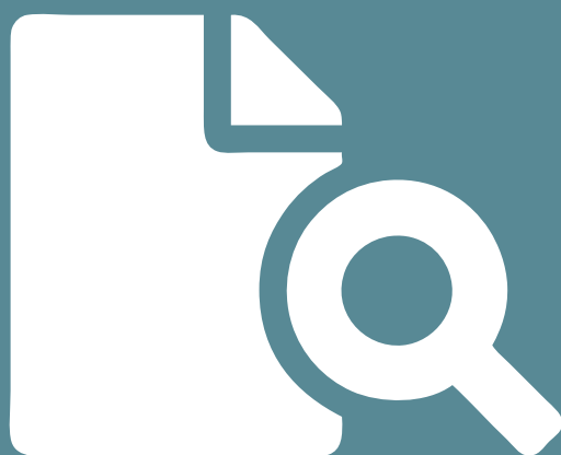
TAVOLA 2 BUDGET FINANZIARIO