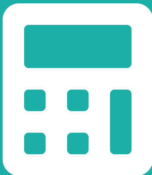
TAVOLA 1 BUDGET ECONOMICO