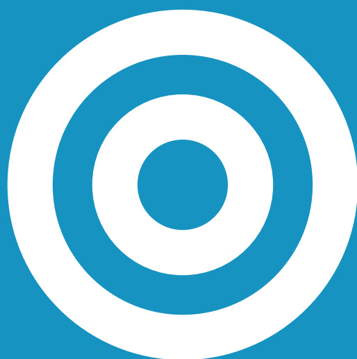
TAVOLA 3 BUDGET DEGLI INVESTIMENTI